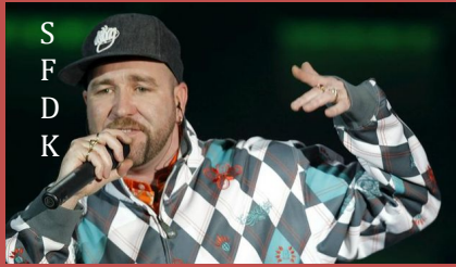
S F D K