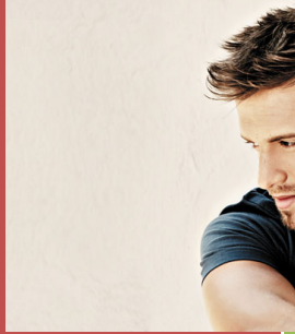
F I T O